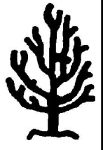
Basse tige fuseau