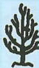
Basse tige fuseau